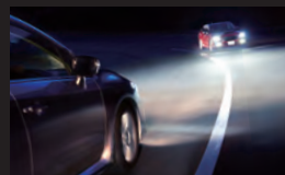
ハイビームアシスト カメラによって前方の光を検知し、状況に応じてハイビーム / ロービームを自動的に切り替え、より明るく安全な夜間視界を確保します。 ※本カメラの機能は車種によって異なります。