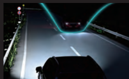
アダプティブド ライビングビーム ステレオカメラで ランプに内蔵され 車両に当たる部分 はハイビームで照 射します。 前方車両を検知。ヘッド たシェードによって前方 を遮光。そのほかの部分