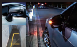
サイドビューモニター* 助手席側ドアミラーに装着されたカメラの映像をマルチファンクションディスプレイに表示。ドライバーからは死角となる自車の左前方の様子を確認できます。