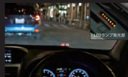
アイサイトアシストモニター アイサイトと連動した表示を、LED によってフロントガラスに投影。アイサイトの作動状況や各種警報を、直感的かつ安全に確認できます。

さらに2017年発売モデルからは2つの機能を加えて “アイサイトセーフティプラス”として展開