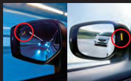
スバルリヤビークルディテクション (後側方警戒支援システム) 車体後部に内蔵されたセンサーにより、車の後側方から接近する車両を検知。ドミラーのインジケーターの点灯や点滅、ドライバーに注意を促します。また、後退支援時には警報音でも注意を促します。