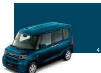
レーザーブルークリスタルシャイン (27,000円高・消費税8%込)