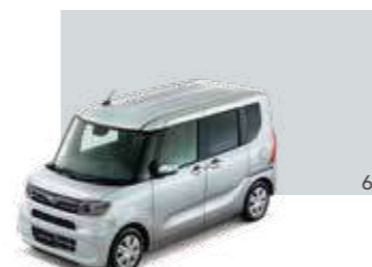
ブライトシルバー・メタリック