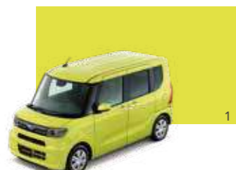
マスタードイエロー・マイカメタリック