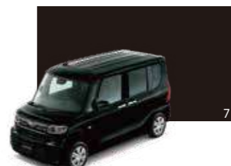
ブラック・マイカメタリック