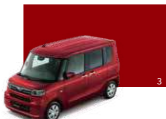
ファイアークォーツレッド・メタリック