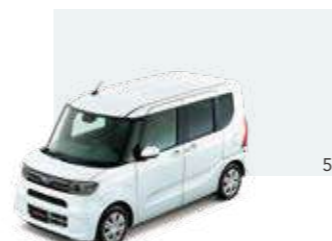
シャイニングホワイト・パール (27,000円高・消費税8%込)