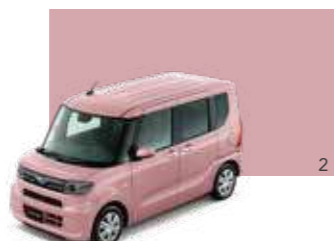
ブルーミングピンク・メタリック