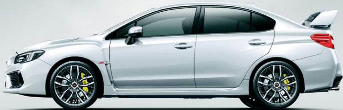
クリスタルホワイト・パール(32,400円高・消費税8%込)