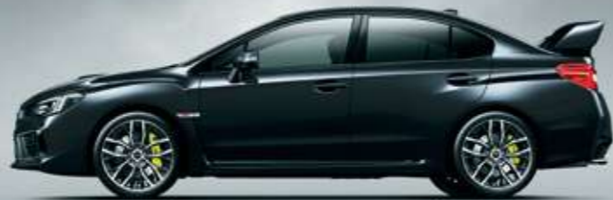
クリスタルブラック・シリカ