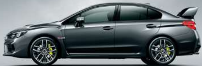
マグネタイトグレー・メタリック