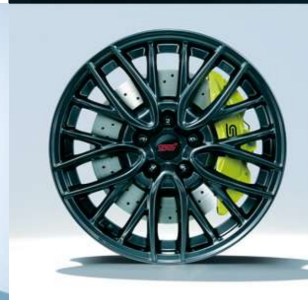
■18インチアルミホイール(ダークガンメタリック塗装)& Brembo製18インチベンチレーテッドディスクブレーキ(写真はフロント)