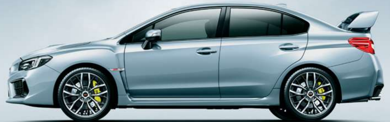
アイスシルバー・メタリック