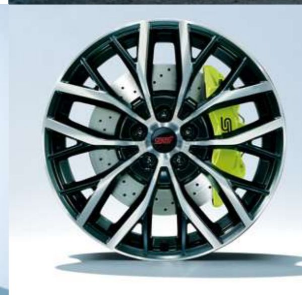
■19インチアルミホイール(ダークガンメタリック塗装+切削光輝)&brembo製18インチベンチレーテッドディスクブレーキ(写真はフロント)