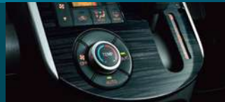
シャドウフロア柄ブラック インパネセンタークラスター*1