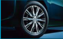
14インチアルミホイール