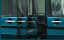
パワースライドドア (右側) パワースライドドア (左側)は標準装備