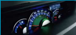
3眼ルミネセントメーター