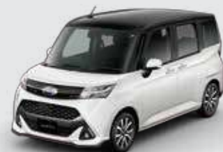
13 ブラック/ パール・ホワイトⅢ*3

■写真の1~8はG スマートアシスト、9~13はカスタムRS スマートアシスト。 ■写真はイメージで、印刷のインクの性質上、実際の色とは異なって見えることがあります。