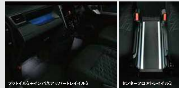
フットイルミ+インパネアップパートレイイルミ センターフロアトレイルミ