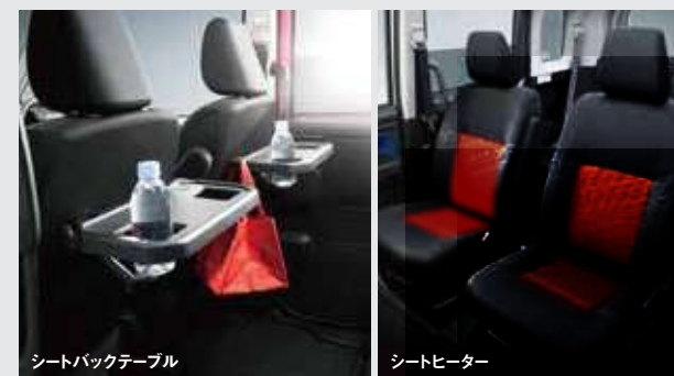
シートバックテーブル シートヒーター

■G スマートアシスト、GS スマートアシストにメーカー装着オプション。カスタムR スマートアシスト、カスタムRS スマートアシストに標準装備。パノラミックビューモニター&ナビアップグレードパッケージは純正以外のナビゲーションシステムを装着した場合の動作保証は致しかねます。 ■ナビ本体は含まれません。別途、ディーラー装着オプションのナビゲーションシステム装着が必要です。 [パノラミックビューモニター] ■サイドアンダーミラーは非装着となり、カメラ(左右)付となります。 ■カメラ映像はTFTカラーマルチインフォメーションディスプレイに表示されます。ディーラー装着オプションのナビゲーションシステムを選択した場合はナビ画像に表示されます。 ■字光式ナンバープレートは装着できません。 [リヤビューカメラ] ■カメラが映し出す範囲は限られています。必ず車両周辺の安全を直接確認してください。 [ステアリングスイッチ] ■ステアリングスイッチは、ディーラー装着オプションのナビゲーションシステムを選択した場合に操作可能となります。