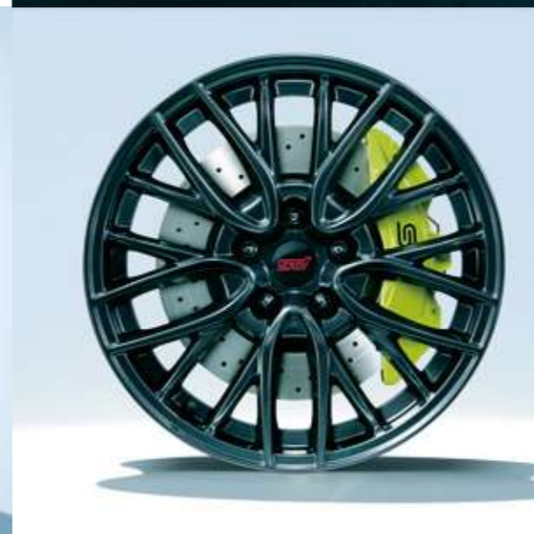
■18インチアルミホイール(ダークガンメタリック塗装)& brembo製18インチベンチレーテッドディスクブレーキ(写真はフロント)