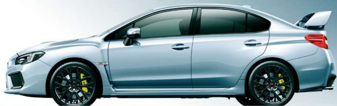
アイスシルバー・メタリック