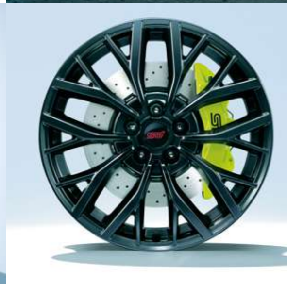
■19インチアルミホイール(ダークガンメタリック塗装)&brembo製18インチベンチレーテッドディスクブレーキ(写真はフロント)