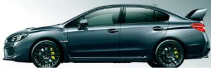
ダークグレー・メタリック