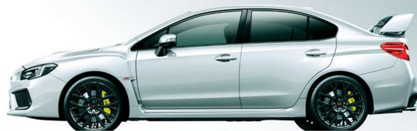
クリスタルホワイト・パール(32,400円高・消費税8%込)