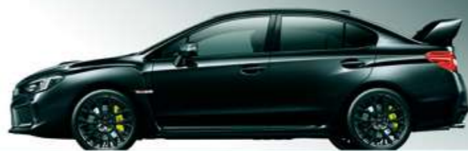
クリスタルブラック・シリカ