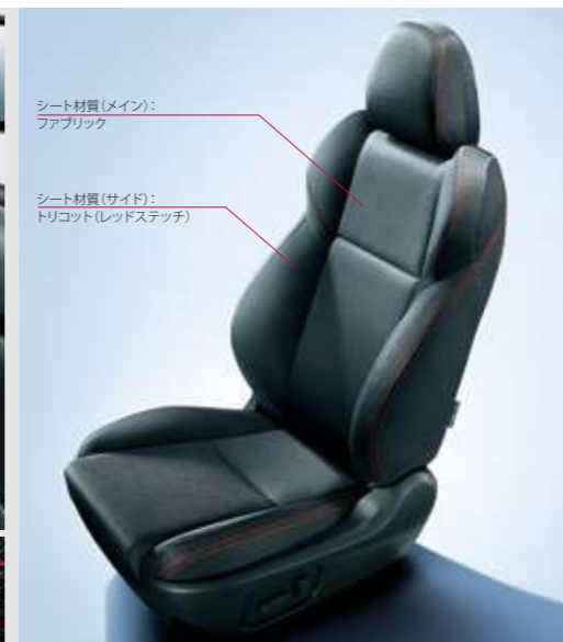
シート材質(メイン): ファブリック