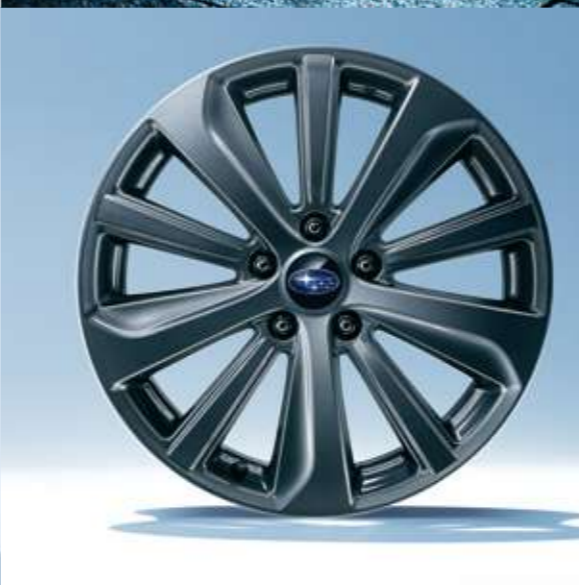
■アルミホイール:18インチ×7.1/2J(ガンメタリック塗装)