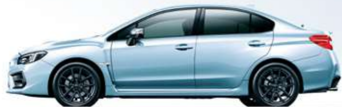
アイスシルバー・メタリック