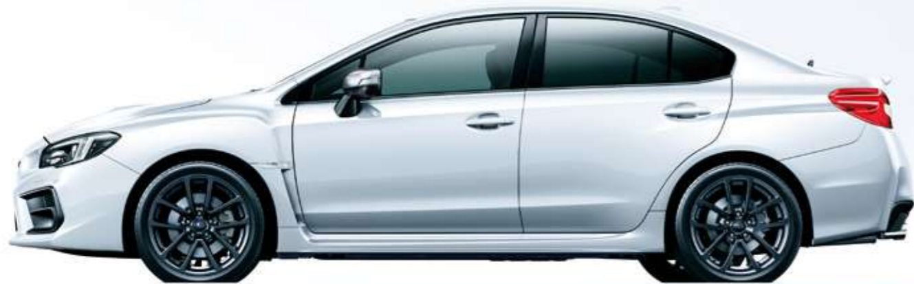
クリスタルホワイト・パール (32,400円高・消費税8%込)