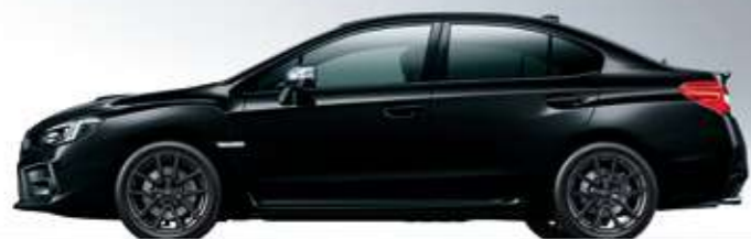
クリスタルブラック・シリカ