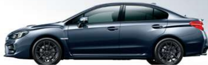
ダークグレー・メタリック