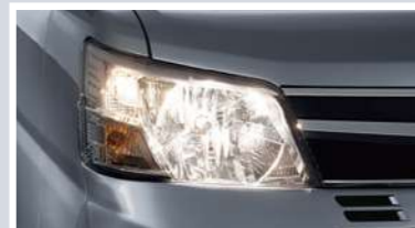
マルチリフレクターハロゲンヘッドランプ