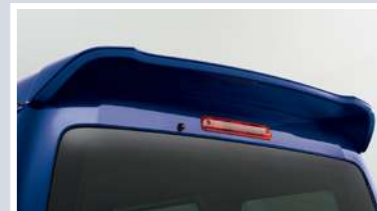
ルーフスポイラー