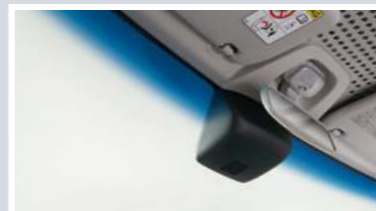
フロントウインドウトップシェード