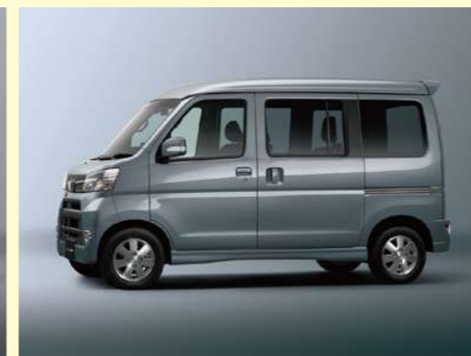
タングステングレー・メタリック