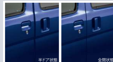
スライドドアアイジークローザー(左側)

※スマートアシスト車の使用については取扱説明書に重要な注意事項が記載されておりますので、必ずお読みください。