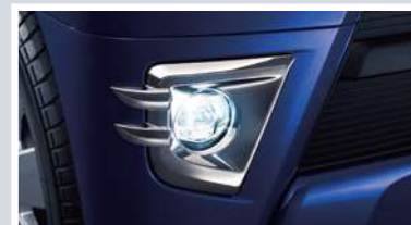
LEDフォグランプ(メッキベゼル付)