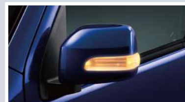
電動格納式リモコンカラードアミラー (サイドターンランプ付)