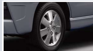
13インチアルミホイール