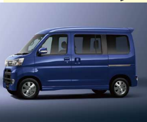
アーバンナイトブルークリスタル・メタリック (27,000円高・消費税8%込)