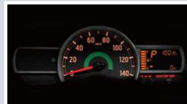
メーター (マルチインフォメーションディスプレイ付)