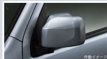
電動格納式リモコンカラードアミラー