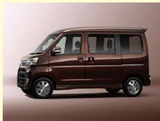
プラムブラウンクリスタル・マイカ (27,000円高・消費税8%込)