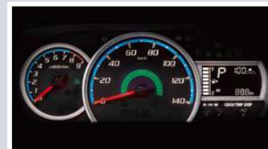
ルミネセントメーター (マルチインフォメーションディスプレイ付)