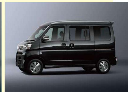
ブラック・マイカメタリック

●記載価格はメーカー希望小売価格に消費税8%が含まれた総額表示です。●メーカー希望小売価格は参考価格です。販売価格は各販売店が独自に決めていますので、それぞれにお問い合わせください。 ●価格はスペアタイヤとタイヤ交換用工具を含む価格です。●価格にはオプションは含まれておりません。●リサイクル料金、税金(消費税を除く)、保険料、登録等に併う諸費用等は別途必要となります。 ●登録等に併う手続き代行費用については別途消費税が必要となります。●この仕様はお断りなく変更する場合があります。※環境対応車普及促進税制について、詳細は販売店にお問い合わせください。