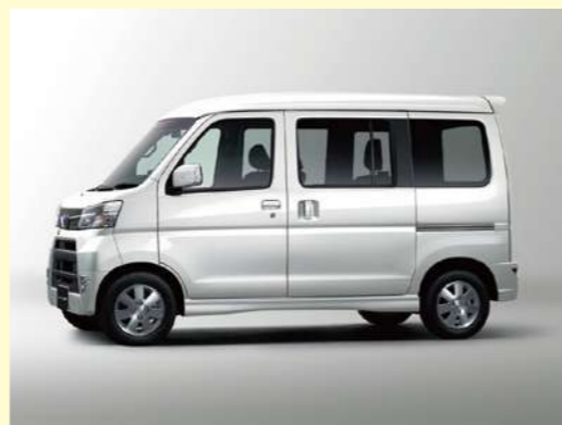
パール・ホワイトIII (27,000円高・消費税8%込)