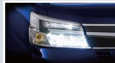
LEDハイ&ロービームランプ