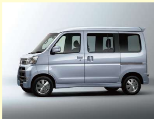
ブライトシルバー・メタリック