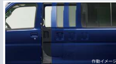
パワースライドドア(左側/挟み込み防止機能付)