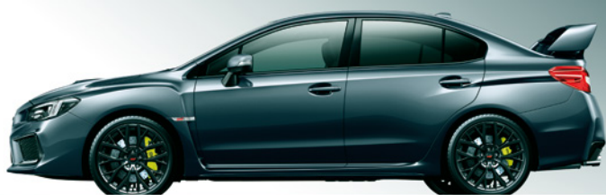
ダークグレー・メタリック