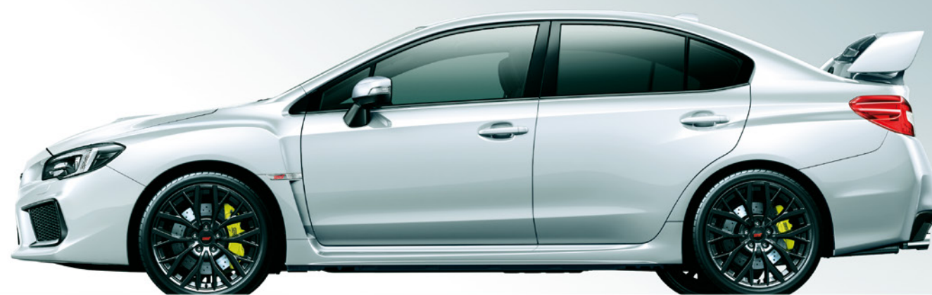
クリスタルホワイト・パール(32,400円高・消費税8%込)