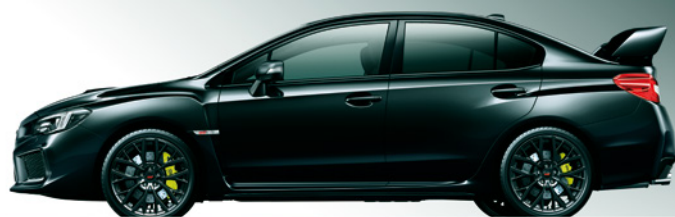
クリスタルブラック・シリカ