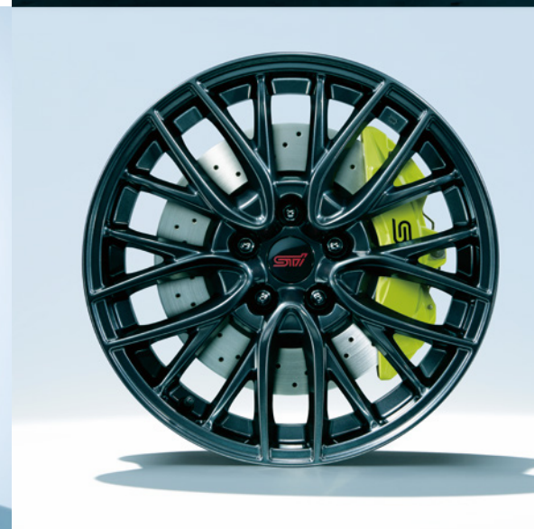
■18インチアルミホイール(ダークガンメタリック塗装)& Brembo製18インチベンチレーテッドディスクブレーキ(写真はフロント)