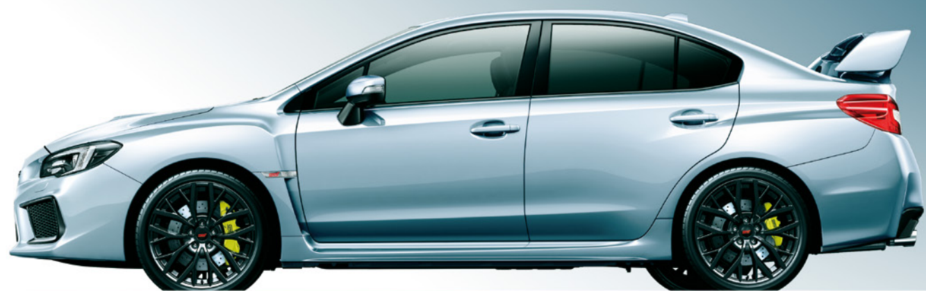
アイスシルバー・メタリック