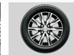
R Limited専用14インチ アルミホイール