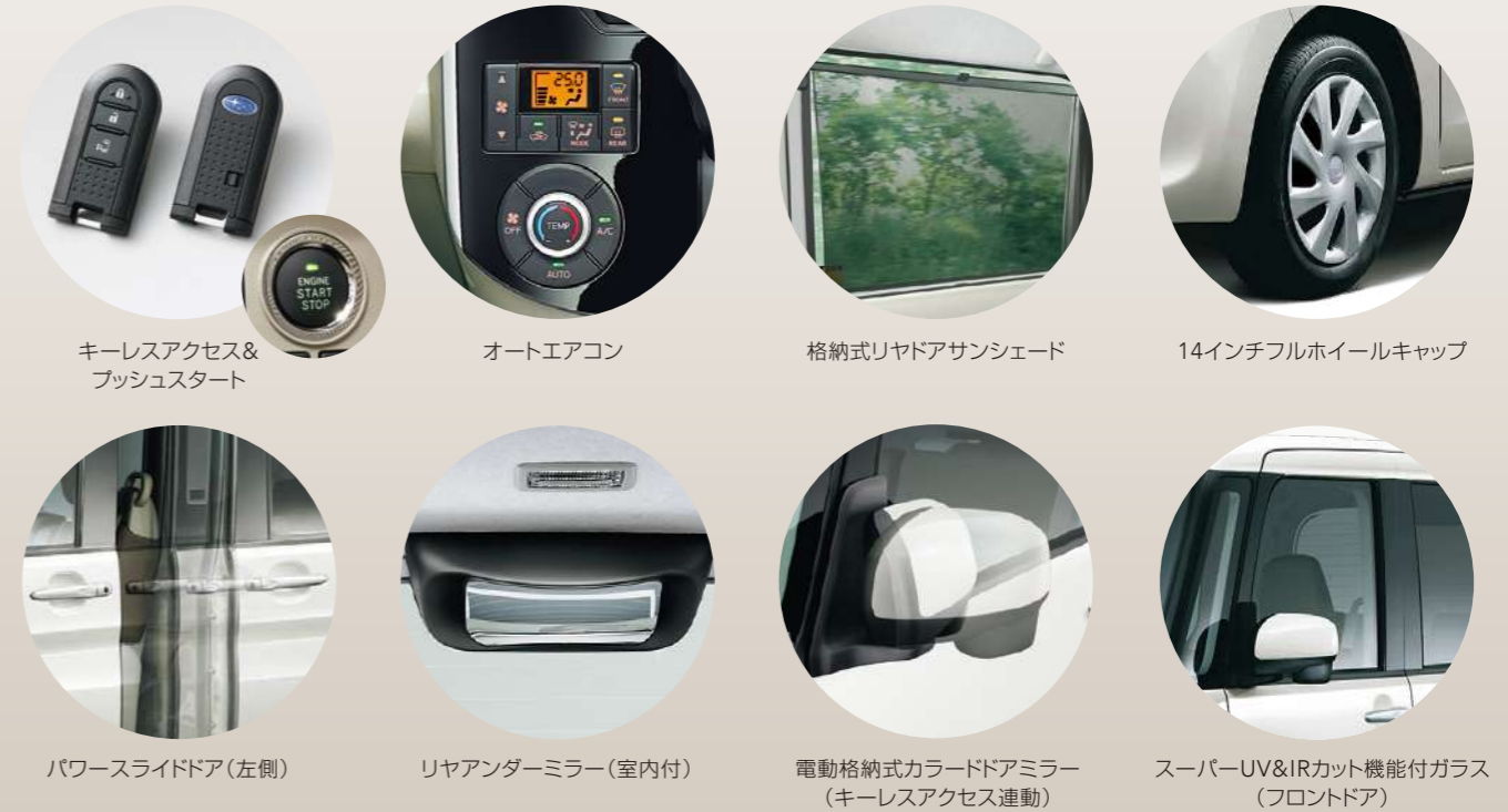
キーレスアクセス& プッシュスタート