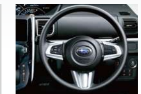
ウレタンステアリングホイール