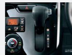
メッキシフトレバーボタン