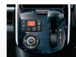
プレミアムシャインディーブ ブルー(マーブル柄)インパネ センタークラスター