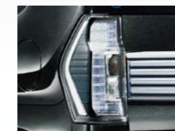
ダークメッキリヤコンビランプ