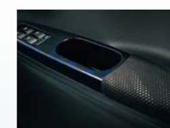
プレミアムシャインディーブ ブルー(マーブル柄)&Limited専用 ファブリックドアアームレスト