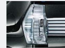
リヤコンビランプ