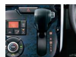
メッキシフトレバーボタン