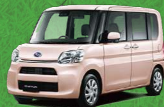
ライトローズ・マイカメタリックⅡ