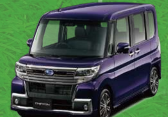
ナイトシャドーパープルクリスタル・メタリック*