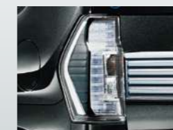
ダークメッキリヤコンビランプ