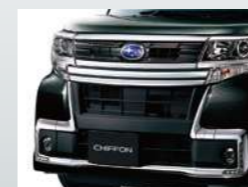
メッキフロントグリル(ダークメッキ)