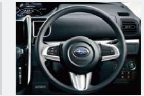
ウレタンステアリングホイール