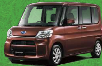
ブラムブラウンクリスタル・マイカ*