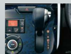
本革巻インパネセンター シフト(メッキシフトレバーボタン付)