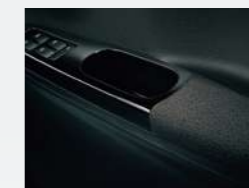
プレミアムシャインブラック& ファブリックドアアームレスト