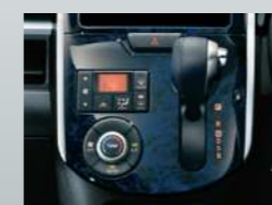
プレミアムシャインディーブ ブルー(マーブル柄)インパネ センタークラスター