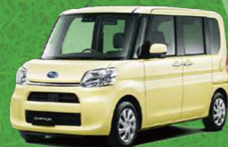
コットンアイボリー