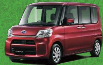
ファイアークォーツレッド・メタリック