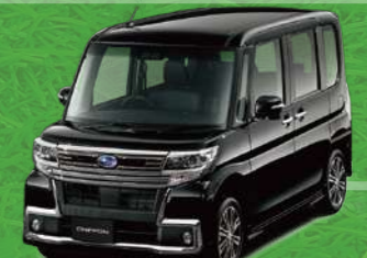
ブラック・マイカメタリック