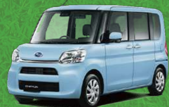
シルキーブルー・パール*