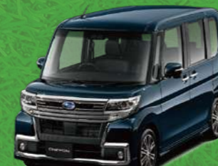
メテオライトグレーイリュージョナル・パール*