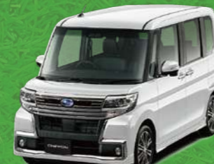
パール・ホワイトⅢ*