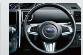
本革巻ステアリングホイール