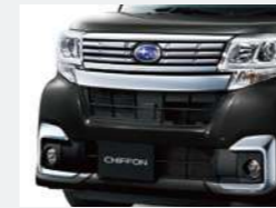
メッキフロントグリル