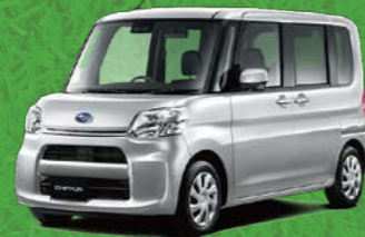
ブライトシルバー・メタリック