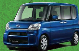
ディープブルークリスタル・マイカ*