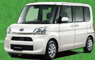
パール・ホワイトⅢ*