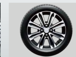
15インチアルミホイール