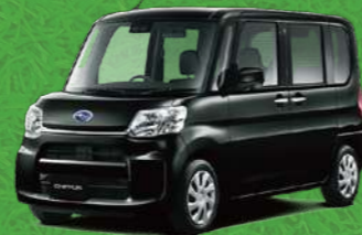
ブラック・マイカメタリック