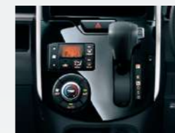
プレミアムシャインブラックインパネ センタークラスター