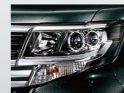
ダークメッキLEDヘッドランプ