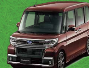
ブラムブラウンクリスタル・マイカ*