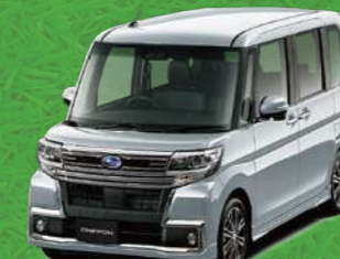
ブライトシルバー・メタリック