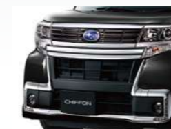
メッキフロントグリル(ダークメッキ)