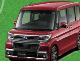
ファイアークォーツレッド・メタリック