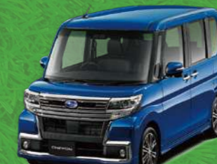
ディープブルークリスタル・マイカ*