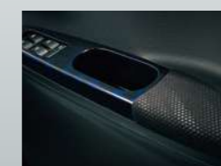
プレミアムシャインディーブ ブルー(マーブル柄)&Limited専用 ファブリックドアアームレスト