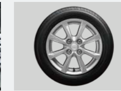
14インチアルミホイール