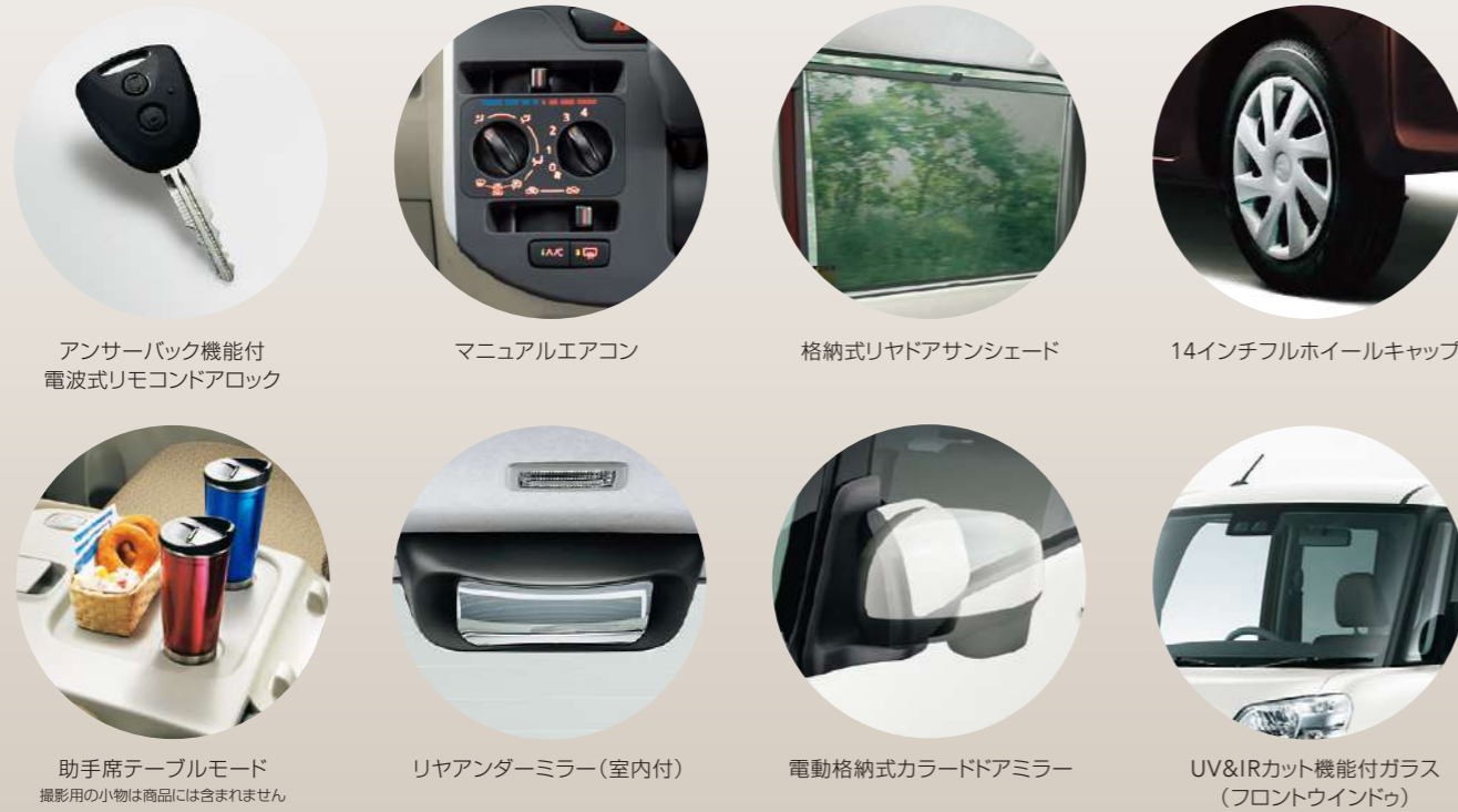
アンサーバック機能付 電波式リモコンドアロック