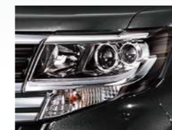
ダークメッキLEDヘッドランプ