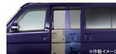
■パワースライドドア(左側/挟み込み防止機能付) (RS Limitedに標準装備)