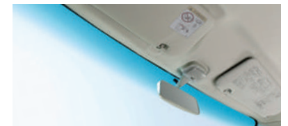
■フロントウインドウトップシェイド (RS Limited,RSに標準装備)