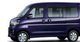
アーバンナイトブルークリスタル・メタリック (27,000円高・消費税8%込)