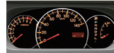
■3眼ルミネセントメーター (RS Limitedに標準装備)