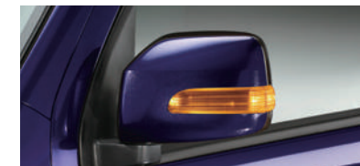
■LEDサイドターンランプ (RS Limitedに標準装備)