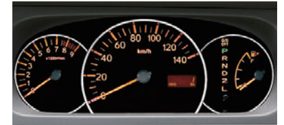
■3眼メーター (RS,LSに標準装備)