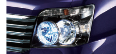
■HIDロービームランプ (RS Limited,RSに標準装備)