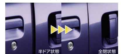
■スライドアイジーローザー(左側) (RS Limited,RSに標準装備,LSにメーカー装着オプション)