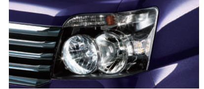
■ハロゲンヘッドランプ (LSに標準装備)