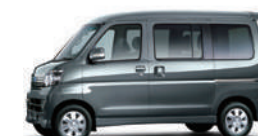
タンクステングレイ・メタリック