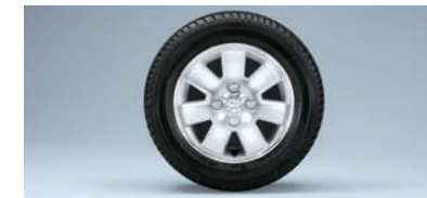
■13インチアルミホイール (RS Limited,RSに標準装備)