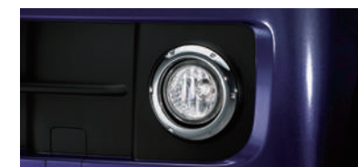
■フロントフォグランプ(メッキリング付) (RS Limited,RSに標準装備)