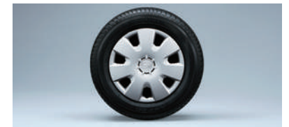
■13インチフルホイールキャップ (LSに標準装備)