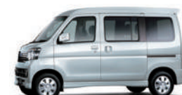
プラチンシルバー・メタリック