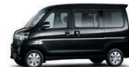
ブラック・マイカメタリック