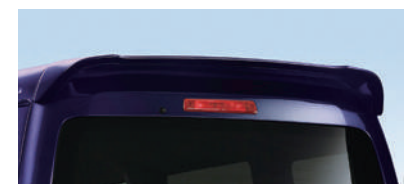
■ルーフスポイラー (RS Limited,RSに標準装備)