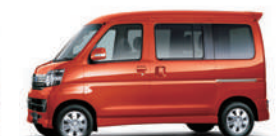
トニコオレンジ・メタリック

●記載価格はメーカー希望小売価格に消費税8%が含まれた総額表示です。●メーカー希望小売価格は参考価格です。販売価格は各販売店が独自に決めていますので、それぞれにお問い合わせください。