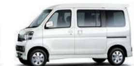
パール・ホワイトⅢ (27,000円高・消費税8%込)