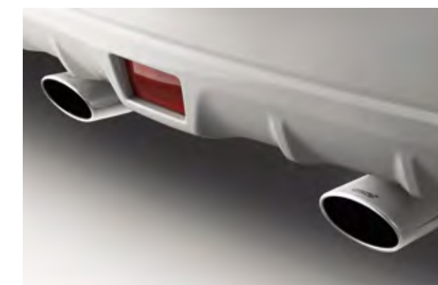
STIスポーツマフラー(STIロゴ入り) [STI装着オプション]

エクステリアと調和するブラックカラーで仕立てた、スタイリッシュなルーフレール。SUVとしての存在感を際立たせます。