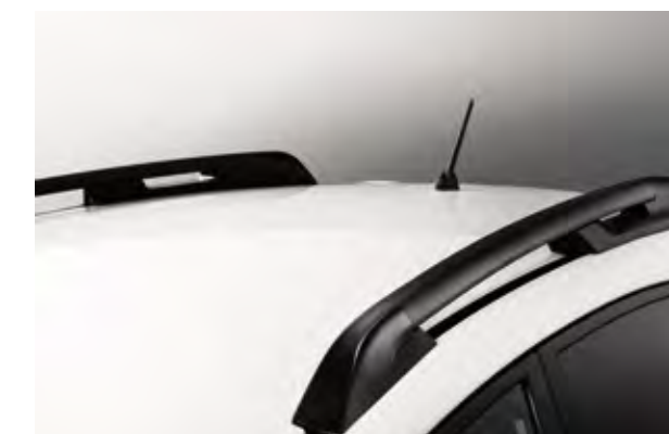
ブラックルーフレール [メーカー装着オプション]

エクステリアと調和するブラックカラーで仕立てた、スタイリッシュなルーフレール。SUVとしての存在感を際立たせます。