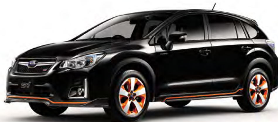
クリスタルブラック・シリカ