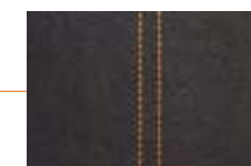
ウルトラスエード (ブラック、 オレンジステッチ)