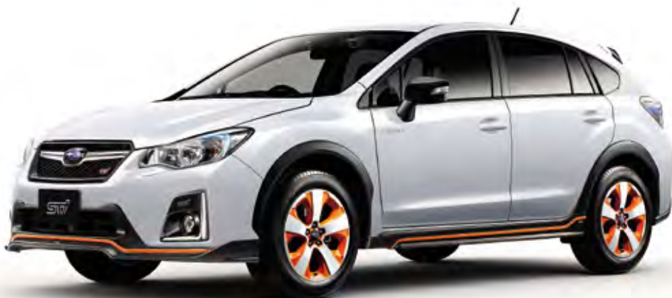
クリスタルホワイト・パール (32,400円高・消費税8%込)

オレンジのピストライプが映える、3色のボディカラーをラインアップ。洗練のクリスタルホワイト・パールか、スポーティなクリスタルブラック・シリカか、大胆なハイパーブルーか。3つのカラーでそれぞれ異なる個性が輝きます。