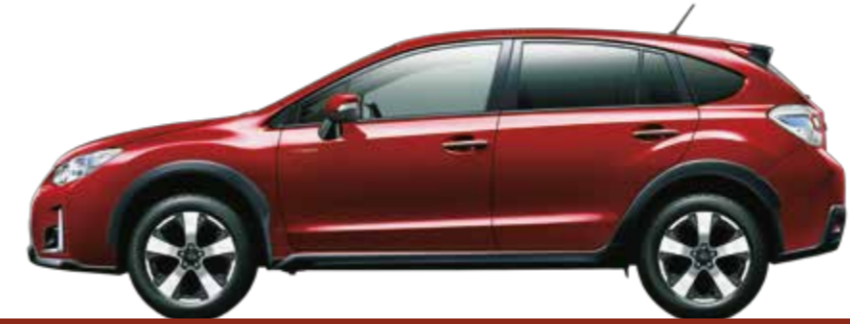
ヴェネチアンレッド・パール (32,400円高・消費税8%込)