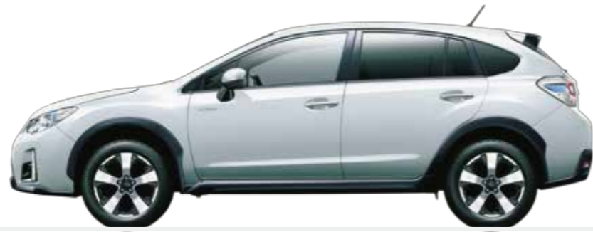
クリスタルホワイト・パール (32,400円高・消費税8%込)