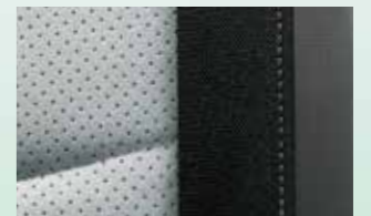
■ SEAT CLOTH: ウルトラスエード(シルバー)/トリコット(シルバーステッチ)