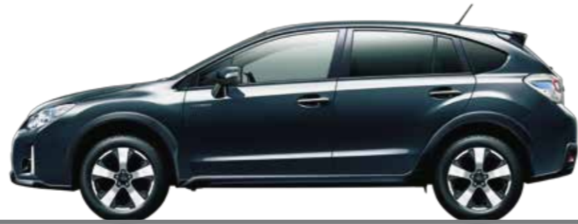
ダークグレー・メタリック