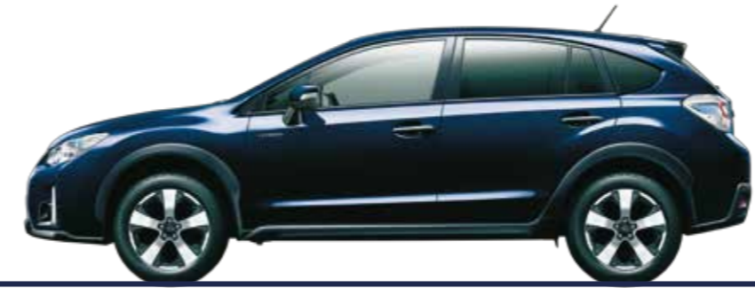
ダークブルー・パール