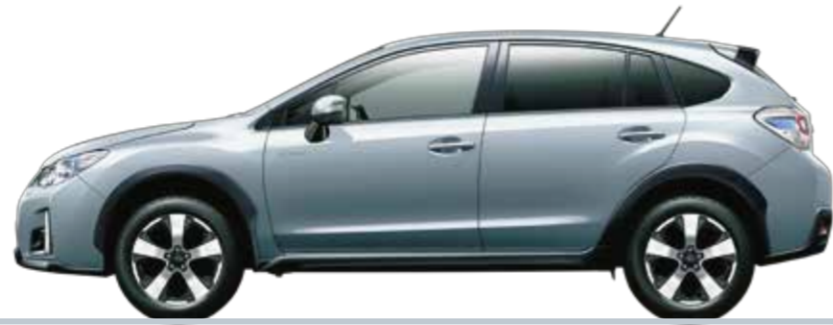
アイスシルバー・メタリック