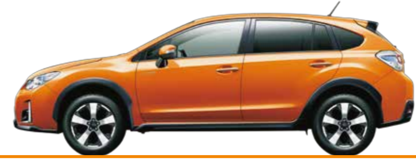
タンジェリンオレンジ・パール