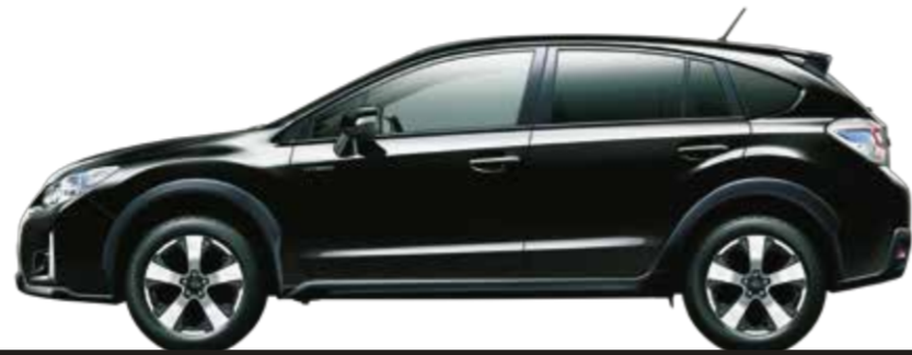
クリスタルブラック・シリカ