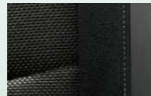
■ SEAT CLOTH: ファブリック/トリコット(シルバーステッチ)