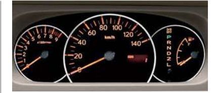
■3眼メーター (RS,LSiに標準装備)