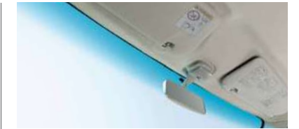
■フロントウインドウトップシェイド (RS Limited,RSiに標準装備)