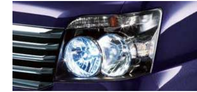
■HIDロービームランプ (RS Limited,RSiに標準装備)