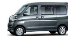
タングステングレー・メタリック