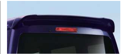
■ルーフスポイラー (RS Limited,RSiに標準装備)