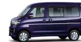
アーバンナイトブルークリスタル・メタリック (27,000円高・消費税8%込)