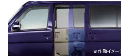
■パワースライドドア(左側/挟み込み防止機能付) (RS Limitedに標準装備)