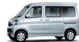
ブライトシルバー・メタリック