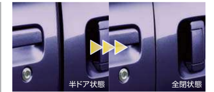
■スライドアイジーローザー(左側) (RS Limited,RSiに標準装備,LSiにメーカー装着オプション)