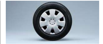
■13インチフルホイールキャップ (LSiに標準装備)