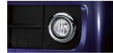
■フロントフォグラップ(メッキリング付) (RS Limited,RSiに標準装備)