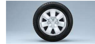
■13インチアルミホイール (RS Limited,RSiに標準装備)