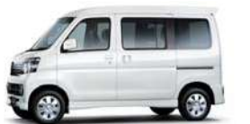
パール・ホワイトⅢ (27,000円高・消費税8%込)