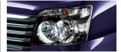
■ハロゲンヘッドランプ (LSに標準装備)