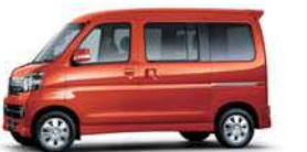
トニコオレンジ・メタリック