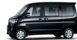
ブラック・マイカメタリック