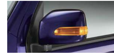
■LEDサイドターンランプ (RS Limitedに標準装備)