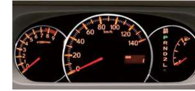
■3眼ルミネセントメーター (RS Limitedに標準装備)