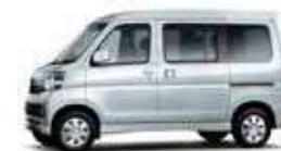
ブライツシルバー・メタリック