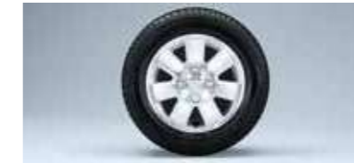
■13インチアルミホイール (RS Limited, RSに標準装備)