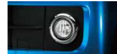
■フロントフォグランプ(メッキリング付) (RS Limited, RSに標準装備)