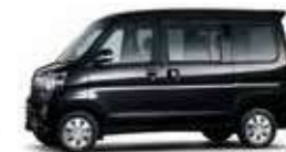
ブラック・マイカメタリック