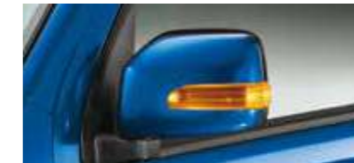
■LEDサイドターンランプ (RS Limitedに標準装備)