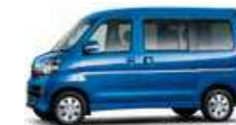
ブルー・マイカメタリック