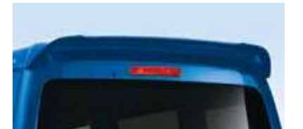
■ルーフスポイラー (RS Limited, RSに標準装備)