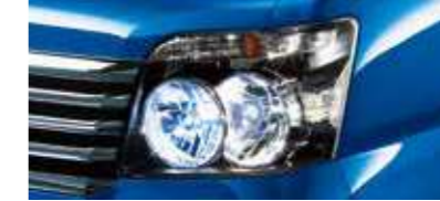
■HIDロービームランプ (RS Limited, RSに標準装備)