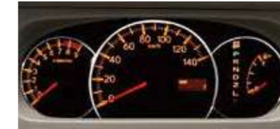
■3眼ルミネセントメーター (RS Limitedに標準装備)