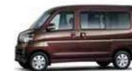
ブラムブラウンクリスタル・マイカ (27,000円高・消費税8%込)