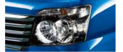
■ハロゲンヘッドランプ (LSに標準装備)