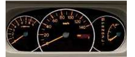
■3眼メーター (RS, LSIに標準装備)