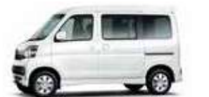
パール・ホワイトIII (27,000円高・消費税8%込)