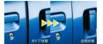
■スライドアイジーローザー(左側) (RS Limited, RSに標準装備, LSIにメーカー装着オプション)

写真は撮影用に点灯しています。装備の詳細につきましては、P.20をご覧ください。