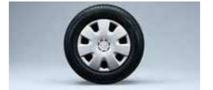
■13インチフルホイールキャップ (LSに標準装備)