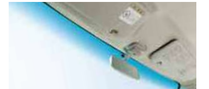
■フロントウインドウツップシェイド (RS Limited, RSに標準装備)