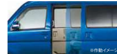
■パワースライドドア(左側/挟み込み防止機能付) (RS Limitedに標準装備)