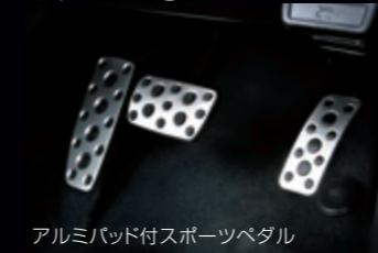
アルミパッド付スポーツペダル