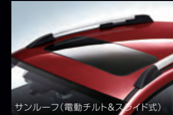
サンルーフ(電動チルト&スライド式)