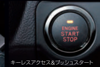
キーレスアクセス&プッシュスタート