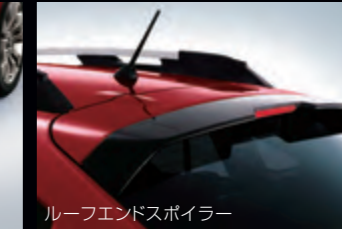
ルーフエンドスポイラー