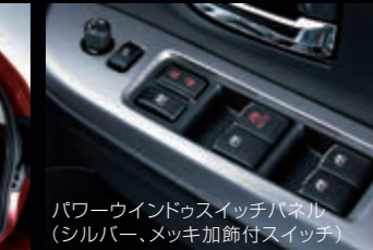
パワーウィンドウスイッチパネル(シルバー、メッキ加飾付スイッチ)