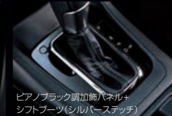
ピアノブラック調加飾パネル+シフトブーツ(シル/バーステッチ)