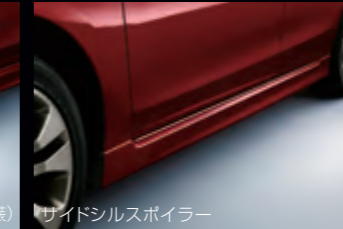
サイドシルスポイラー