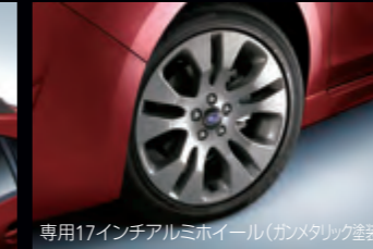
専用17インチアルミホイール(ガンメタリック塗装)