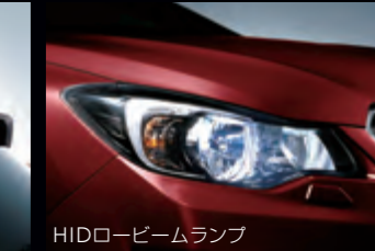
HIDロービームランプ