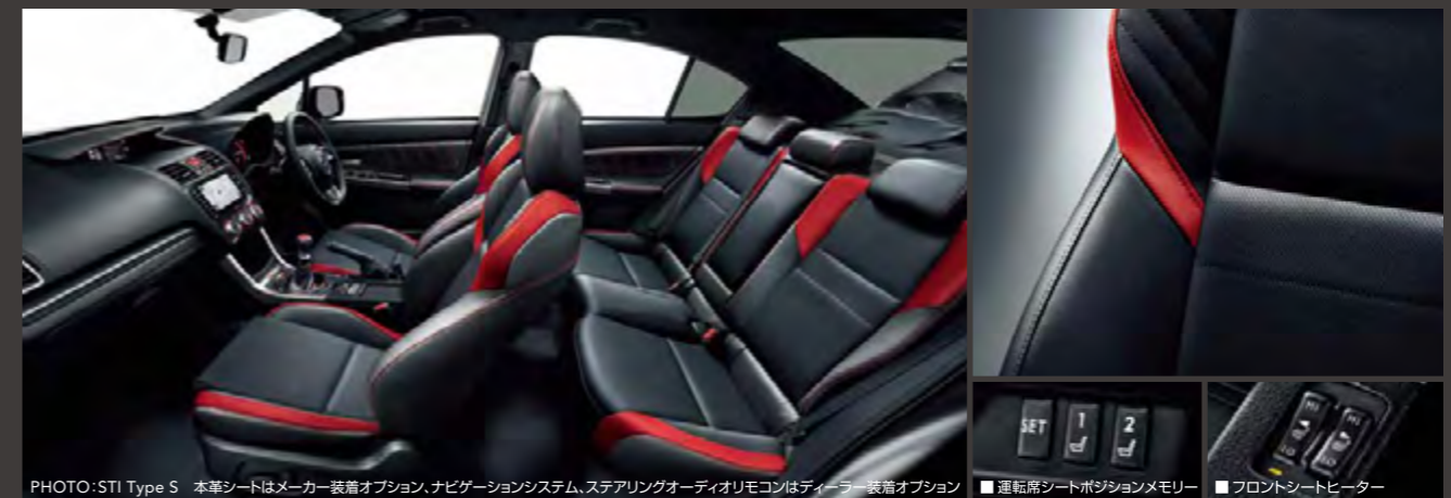
PHOTO:STI Type S 本革シートはメーカー装着オプション。ナビゲーションシステム、ステアリングオーディオリモコンはディーラー装着オプション

滑らかな質感とスポーティな雰囲気が魅力の本革シート。洗練されたインストルメントパネルとのコーディネートが上質な空間を演出する。