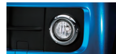
■フロントフォグラップ(メッキリング付) (RS Limited,RSに標準装備)