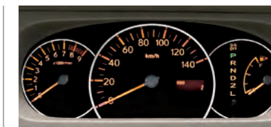
■3眼メーター (RS,LSに標準装備)