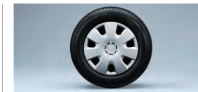
■13インチフルホイールキャップ (LSに標準装備)