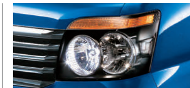
■ハロゲンヘッドランプ (LSに標準装備)