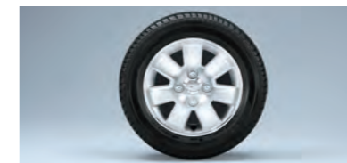
■13インチアルミホイール (RS Limited,RSに標準装備)