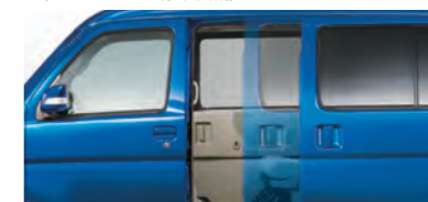
■パワースライドドア(左側/挟み込み防止機能付) (RS Limitedに標準装備)