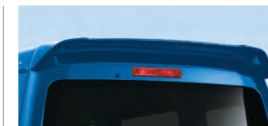
■ルーフスポイラー (RS Limited,RSに標準装備)