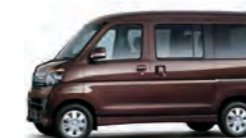
プラムブラウンクリスタル・マイカ (26,250円高・消費税込)