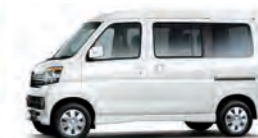
パール・ホワイトⅢ (26,250円高・消費税込)