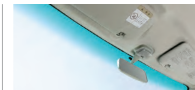
■フロントウインドウツップシェイド (RS Limited,RSに標準装備)