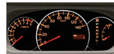
■3眼ルミネセントメーター (RS Limitedに標準装備)