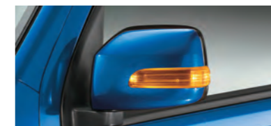
■LEDサイドターンランプ (RS Limitedに標準装備)