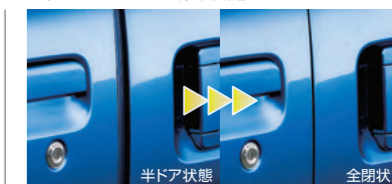
■スライドアイジーローザー(左側) (RS Limited,RSに標準装備,LSにメーカー装着オプション)

写真は撮影用に点灯しています。装備の詳細につきましては、P.20をご覧ください。