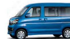
ブルー・マイカメタリック