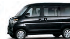
ブラック・マイカメタリック