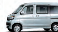
ブライトシルバー・メタリック