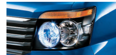
■HIDロービームランプ (RS Limited,RSに標準装備)